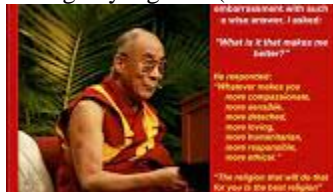
Pengertian yang bijak (Bhante Punnaji)